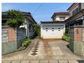
車庫・駐車スペース