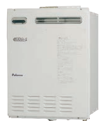
本体・操作パネル