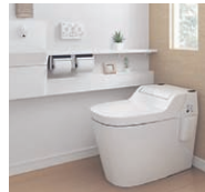
本体・機能付便座 手洗器・換気扇