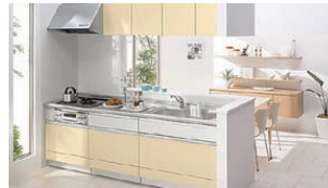
コンロ (ガス・IH)・レンジフード ビルトイン浄水器・水栓 ビルトイン食器洗い乾燥機