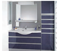
本体 (照明・くもり止め ヒーター・排水ボタン) 換気扇・水栓