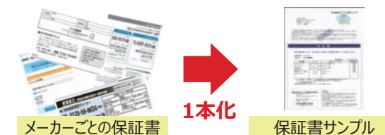
メーカーごとの保証書

メーカーごとの保証書・連絡先を探すお手間をなくし、スムーズな対応をご提供します。