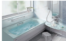
本体 (排水ボタン) 浴室換気 (暖房) 乾燥機・水栓